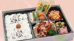
牛しゃぶおろしポン酢弁当