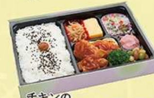
チキンの まるやかトマト煮弁当