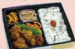
鶏のから揚げ弁当

鶏料理が盛りだくさんのお弁当です。鶏そぼろご飯と一緒に惣菜をお召し上がりください。