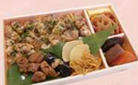
浅草観音裏の深川めし