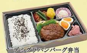
デミグラハンバーグ弁当