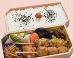
昭和おもひで弁当