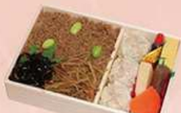
浅草鶏シュウマイ弁当