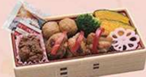
やわらか焼き鳥弁当