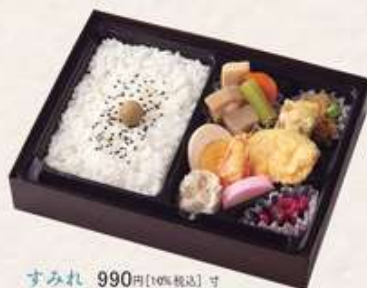
すみれ 990円[10%税込] 寸法 167×217×35 商品番号 24428