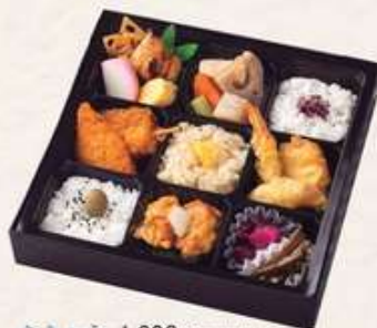
ききょう 1,320円[10%税込] 寸法 215×215×40 商品番号 24426