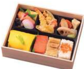
竹取【たけとり】1,650円[10%税込] 寸法 150×185×50 商品番号 24431