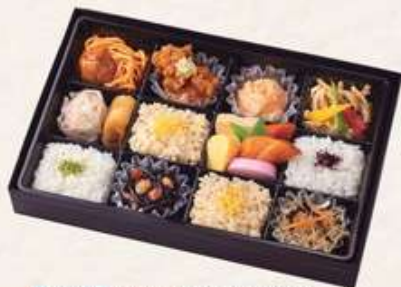
華の四季【はなのしき】 1,650円[10%税込] 寸法 180×280×40 商品番号 24425