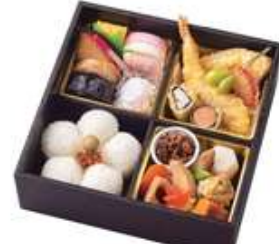
鏡獅子【かがみせし】3,300円[10%税込] 寸法 190×190×60 商品番号 24402