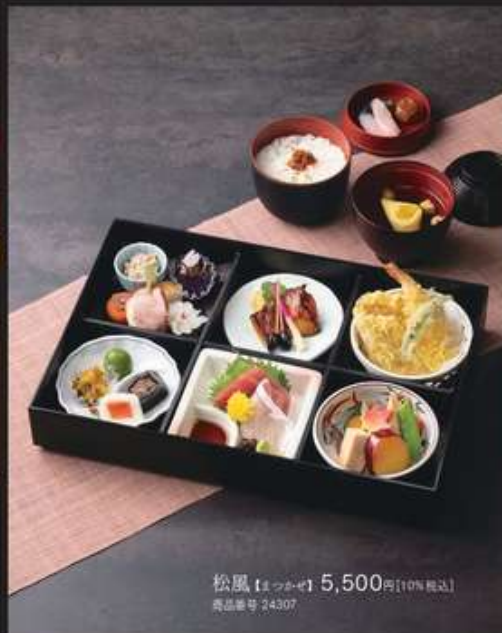
松風【マツカゼ】5,500円[10%税込] 商品番号 24307