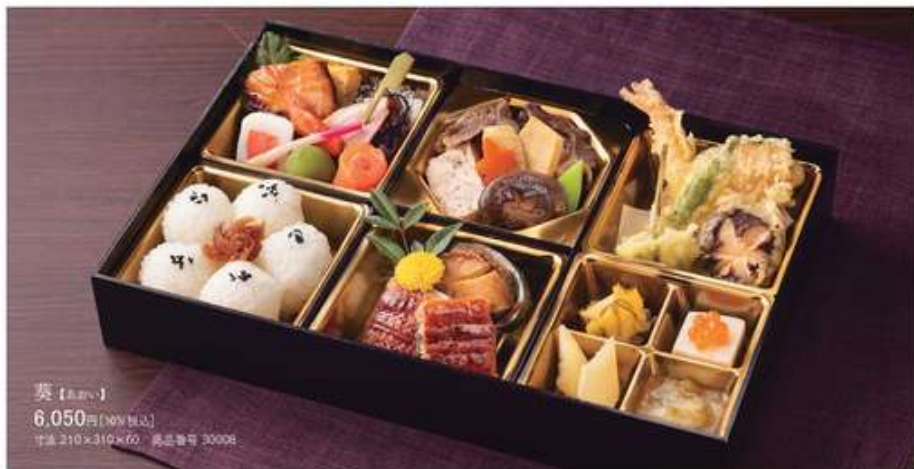
葵 【9-10月】 6,050円(10%税込) 寸法 210×310×60 商品番号 30008