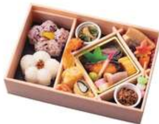
春の琴【はるのこも】2,200円[10%税込] 寸法 145×220×60 商品番号 24407