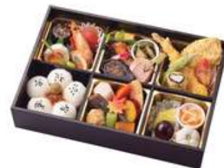
六歌仙【ちのこせん】3,630円[10%税込] 寸法 188×278×60 商品番号 24401