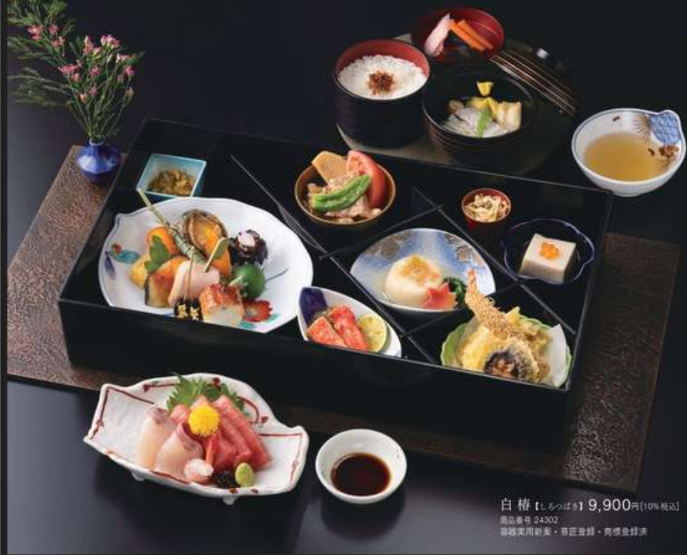
白椿【しろつばき】9,900円[10%税込] 商品番号 24302 容器実用新案・草紙登録・商標登録済