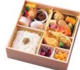
ひとつ白梅【ひとつしらうめ】1,870円[10%税込] 寸法 168×168×60 商品番号 24410