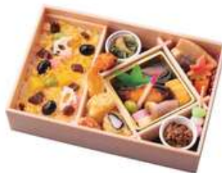
花小袖【はなこもで】2,640円[10%税込] 寸法 145×220×60 商品番号 24407-a