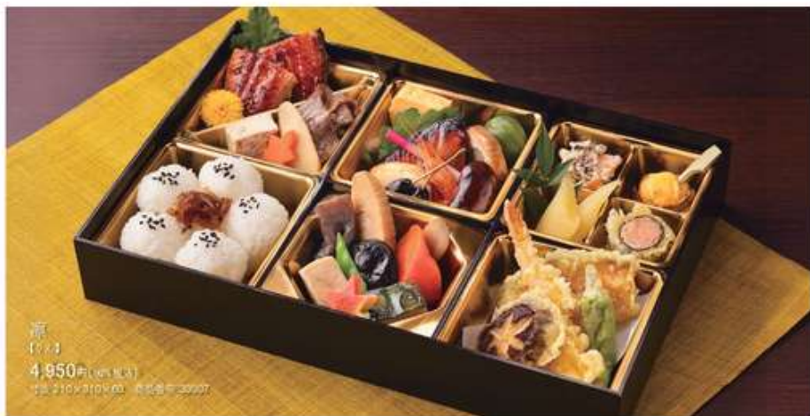
凧 【7-8月】 4,950円(10%税込) 寸法 210×278×60 商品番号 30007