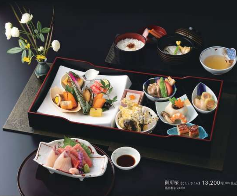
御所桜【ごしよざくら】13,200円[10%税込] 商品番号 24301