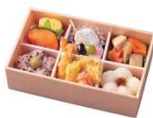
羽衣【はごろも】1,540円[10%税込] 寸法 120×200×60 商品番号 24411