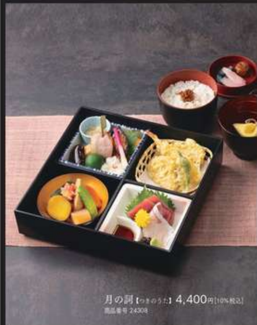
月の詞【つきのはらた】4,400円[10%税込] 商品番号 24308