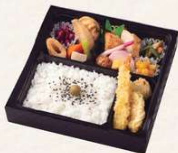
古都の四季【このとのしき】 1,650円[10%税込] 寸法 215×215×40 商品番号 24423