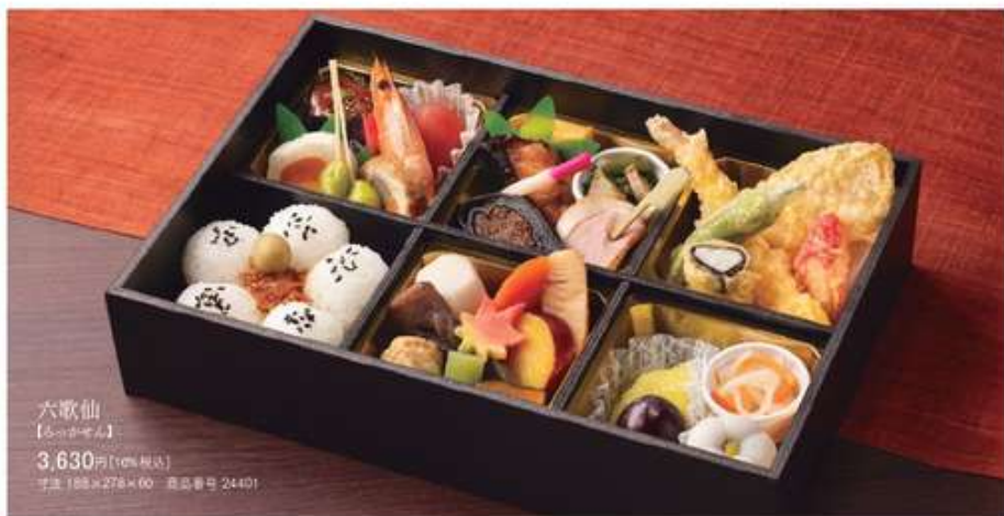
六歌仙 【5-6月限定】 3,630円(10%税込) 寸法 188×278×60 商品番号 24401