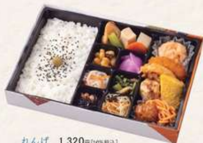
れんげ 1,320円[10%税込] 寸法 175×245×40 商品番号 24424