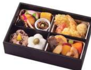
紅ごよみ【べにごよみ】2,200円[10%税込] 寸法 143×210×55 商品番号 24405