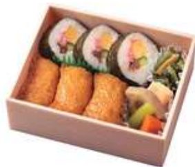
しのだの森【しのだのもり】1,100円[10%税込] 寸法 128×158×52 商品番号 24433