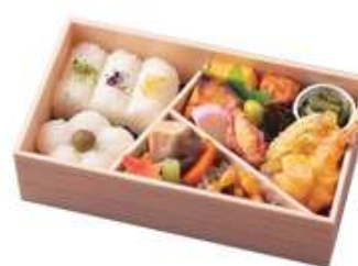
春がすみ【はるがすみ】1,650円[10%税込] 寸法 118×210×60 商品番号 24408