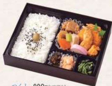
つくし 990円[10%税込] 寸法 167×217×35 商品番号 24427