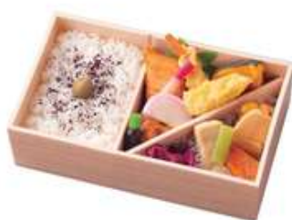
あやめ 1,320円[10%税込] 寸法 115×195×60 商品番号 24412