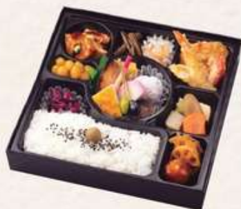
江戸の四季【えどのしき】 1,980円[10%税込] 寸法 215×215×40 商品番号 24421