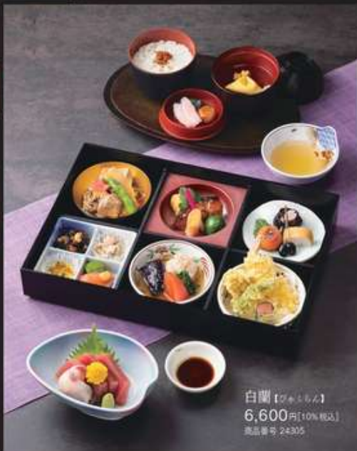
白蘭【びやくらん】6,600円[10%税込] 商品番号 24305